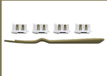
un manche et quatre têtes – une brosse pour toute l'année