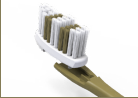
mécanisme simple pour le changement de tête