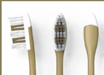
tête amovible sans transition