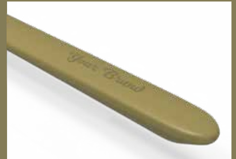
votre brosse, votre marque!