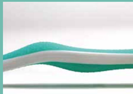
positionnement sûr du pouce dans le creux dédié