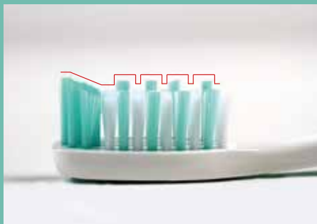
la coupe spéciale en dégradé permet un soin interdentaire amélioré