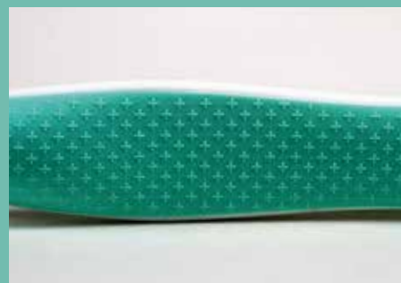
surface en TPE antidérapant agréable