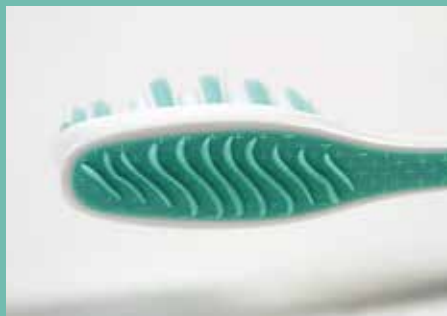
gratte-langue intégré à la tête de brosse